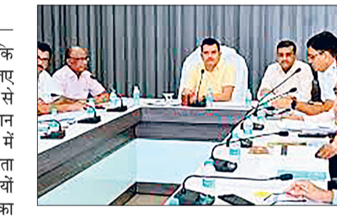
लिफ अनेक फ्लैगशिप योजनाएं शुरू की हैं, जिससे लोगों के जीवन में सकारात्मक बदलाव आ रहा है। उन्होंने शासन की जनकल्याणकारी योजनाओं का प्रिंट, इलेक्ट्रॉनिक, डिजिटल व सोशल मीडिया के माध्यम से अधिक से अधिक प्रचार-प्रसार करने के निर्देश दिए।