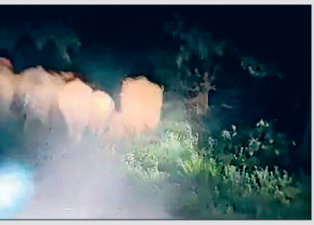
रहवासी क्षेत्र में आने से रोकने जंगल से भगा रहे - गौरलख है कि हाथी एक दिन में 40 से 50 किलोमीटर चलता है। इस वजह से हाथी जंगल के रास्ते होते हुए रहवासी क्षेत्र पहुंच जाते हैं। रायगढ़ तथा धरमजयगढ़ वनमंडल के जिस जंगल में हाथी आने की सूचना मिल रही है, उस वनमंडल के ग्रामीण हाथियों को अपने वनक्षेत्र से भगाने ट्रैक्टर से निकल रहे हैं। कवजीव अधिनियम के अनुसार इस तरह जंगल से हाथियों को भगाना अपराध की श्रेणी में आता है। बावजूद इसके वन विभाग ग्रामीणों के आक्रोश को देखते हुए उनके खिलाफ कार्रवाई नहीं कर पा रहा है।

राज्य के ज्यादातर जिला हाथी प्रभावित हो गए हैं। जसपुर, सरगुजा, रायगढ़, कोरबा तक सिमित रहने वाला हाथी मैदानी क्षेत्र तक पहुंच गए हैं। राज्य के बलौदाबाजार, महासमुंद्र, सारंगद-बिलाईगढ़ तथा बलौदाबाजार वनमंडल में पड़ोसी राज्य ओडिशा के हाथी यहां आकर डेरा जमा लिया है। सारंगद-बिलाईगढ़ वनमंडल में पिछले दो साल के 26 हाथी मृत्युएं कर रहे हैं वह ओडिशा से आए हुए हाथी हैं।